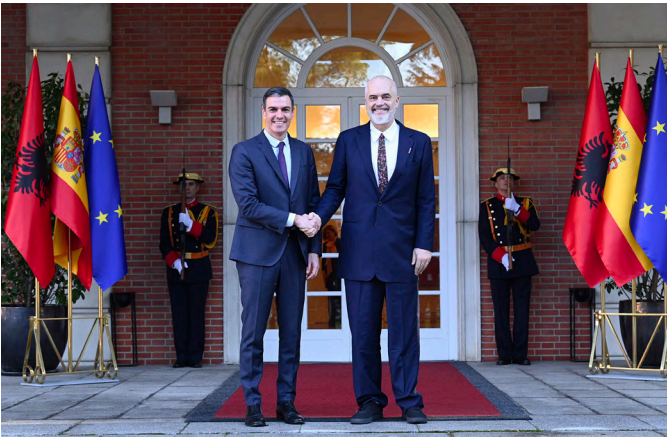
El presidente del Gobierno, Pedro Sánchez, recibe al primer ministro de la República de Albania, Edi Rama. La Moncloa, Madrid 23.1.2024

En octubre de 2025 tuvo lugar la puesta en marcha para Albania del mecanismo del SEPA (Single European Payments Area), lo que se espera que reduzca el coste de transacciones en euros realizadas por operadores del país, entre ellos los migrantes que remiten dinero a sus familiares desde el extranjero. La Comisión presentó la medida, que por primera vez afecta a candidatos a la integración (Montenegro y Albania), como una vía para facilitar el acceso progresivo a ciertas áreas del mercado único y un efecto del Plan de Crecimiento.