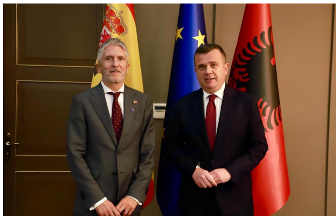
El ministro del Interior, Taulant Balla, ha mantenido un encuentro con el ministro del Interior de España, Fernando Grande-Marlaska, sobre cooperación en la lucha contra redes criminales.

El principal partido de la oposición, el Partido Democrático (PD), que emergía de una larga crisis interna, ha sufrido un descenso sustancial del número de escaños en el parlamento (50 diputados, frente a los 63 de 2021).