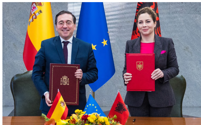
El ministro español de Asuntos Exteriores, José Manuel Albares y su anterior homóloga albanesa Olta Xhaka, firman un memorando de entendimiento para reforzar la colaboración en el proceso de integración europea

27/11/2023 , Visita a Barcelona de la Viceministra Megi Fino en el marco del 8º Foro Regional “Unión por el Mediterráneo”.