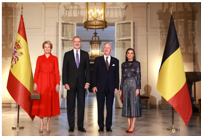
Sus Majestades los Reyes y Sus Majestades los Reyes de los belgas, con motivo de la inauguración de la trigésima edición del Festival Europalia 2025 dedicado a España, Palacio Real (Bruselas), 07.10.2025.

22 octubre: Vicepresidenta del Gobierno español y ministra par la Transición Ecológica y el Reto Demográfico, Teresa Ribera Rodríguez. Conferencia Le rapport Meadows à 50 ans en la Academia Real de Bélgica.