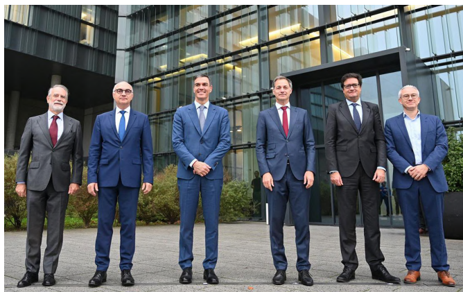
El presidente del Gobierno, Pedro Sánchez, junto al primer ministro belga, Alexander de Croo, el ministro para la Transformación Digital y de la Función Pública, Óscar López, y el equipo directivo de IMEC. Lovaina (Bélgica), 18/10/2024.