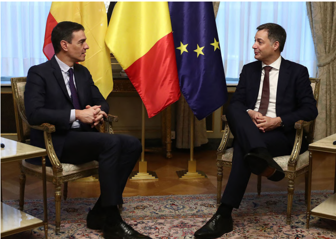
Pedro Sánchez asiste a la reunión del Consejo Europeo, donde mantiene una reunión con el primer ministro de Bélgica, Alexander De Croo, 23/03/2023.

2022, impulsada por la energía, alimentos y la inflación subyacente. La inflación general, que se redujo al 2.3% en 2023, aumentó al 4.3% en 2024 y descenderá nuevamente al 2.8% en 2025. Si bien se espera moderación en los precios de la energía, la inflación se deberá sobre todo a los servicios (en particular precios de los transportes públicos) si bien, se espera que todos los componentes de la inflación se desaceleren en 2026 con una estimación de 1,8%.