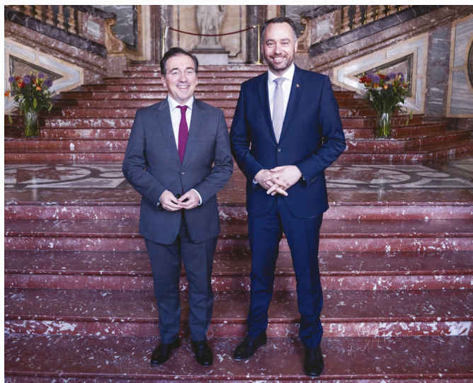
El ministro de Asuntos Exteriores español, José Manuel Albares, junto a su homólogo el ministro de Asuntos Exteriores belga, Maxime Prévot, durante la presentación del programa del festival EUROPALIA ESPAÑA, Biblioteca del Palacio Egmont, Bruselas (Bélgica), 20/05/2025.- Foto: ©MAEC.