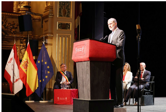
Su Majestad el Rey durante su intervención en el Real Teatro Municipal de Brujas, con ocasión de la clausura del Curso académico 2024/2025 del Colegio de Europa, con ocasión de la celebración de su 75º aniversario, Real Teatro Municipal de Brujas (Bélgica), 20.06.2025.