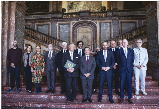
El ministro de Asuntos Exteriores español, José Manuel Albares, junto a su homólogo el ministro de Asuntos Exteriores belga, Maxime Prévot, durante la presentación del programa del festival EUROPALIA ESPAÑA, Biblioteca del Palacio Egmont, Bruselas (Bélgica), 20/05/2025.- Foto: © MAEC.

En el capítulo de visitas de los últimos años, S.M. el Rey Felipe VI participó en Lieja, el 4 de agosto de 2014, en las conmemoraciones del inicio de la Primera Guerra Mundial. Asimismo, SS.MM. los Reyes realizaron una visita de presentación a Bélgica el 11 y 12 de noviembre de 2014 y SS.MM. los