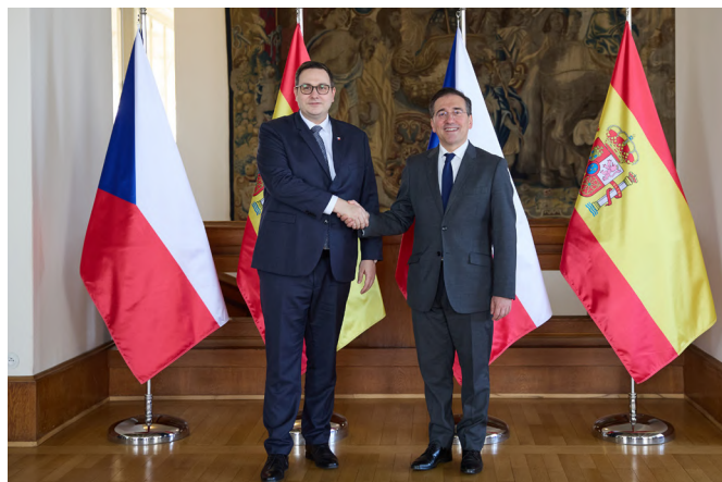
El ministro de Asuntos Exteriores español, José Manuel Albares, junto a su homólogo, el Ministro de Asuntos Exteriores de la República Checa, Jan Lipavský. Praga 16 de abril de 2025.

Los días 8 y 9 de octubre de 2021 se celebraron por última vez elecciones generales, en las que se eligieron a los 200 miembros de la Cámara de Diputados de la República Checa. La coalición tripartita de centroderecha, SPOLU (ODS, KDU-ČSL y TOP 09), ganó la votación en porcentaje, aunque quedó con