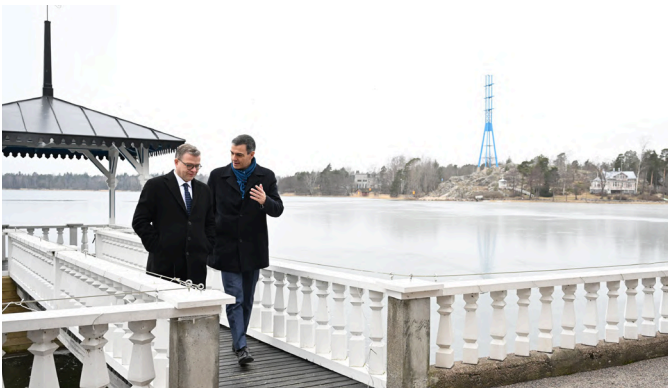
El presidente del Gobierno, Pedro Sánchez, junto a su homólogo el primer ministro de Finlandia, Petteri Orpo. Helsinki, 12.03.2025.