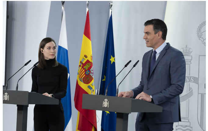
El presidente del Gobierno, Pedro Sánchez, se reúne con la exprimera ministra de la República de Finlandia, Sanna Marin, a quien ha recibido en La Moncloa. La Moncloa, Madrid 26.1.2022.

Asimismo, Finlandia promovió la creación, en mayo de 2017, del Centro de Excelencia contra las Amenazas Híbridas , con sede en Helsinki, del que