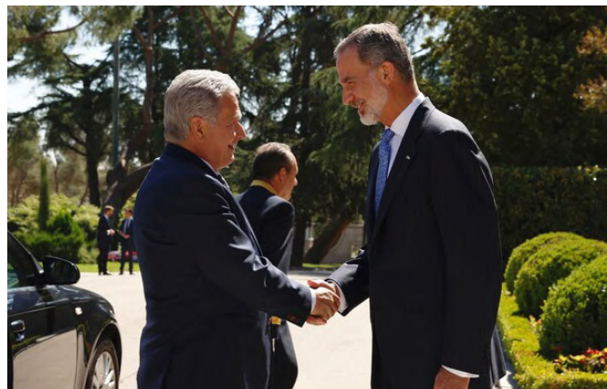
Su Majestad el Rey recibe el saludo del ex-Presidente de la República de Finlandia, Sauli Väinämö Niinistö, a su llegada al palacio de la zarzuela.-29/06/2022.-foto: © Casa de S.M. el Rey

Web: www.facebook.com/profile.php?id=100075675288974