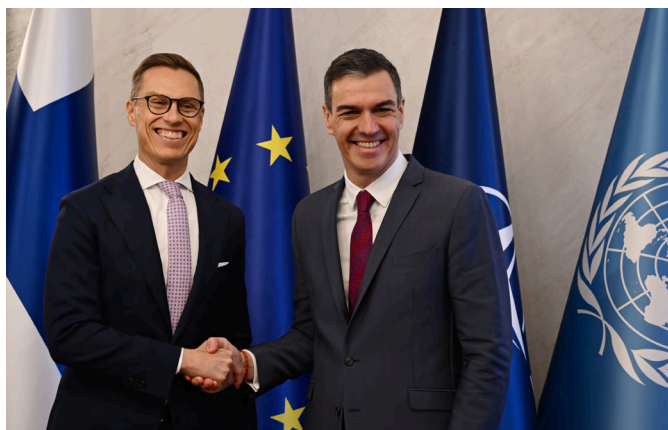
El presidente del Gobierno, Pedro Sánchez, junto al presidente de la República de Finlandia, Alexander Stubb. Helsinki, 12.03.2025.

El Presidente es elegido mediante sufragio universal por un período de seis años y por un máximo de dos mandatos consecutivos. Las últimas elecciones presidenciales han tenido lugar en febrero de 2024, con la elección en segunda vuelta de Alexander Stubb como Presidente de la República, con el 51,6% de los votos. Su rival, el antiguo Ministro de Exteriores del partido Verde Pekka Haavisto, obtuvo el 48,4% de los apoyos.