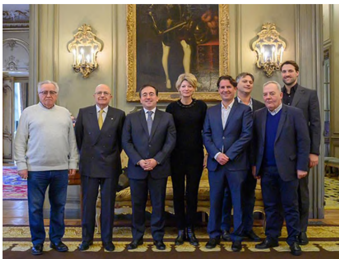
Foto de familia de la reunión del Ministro José Manuel Albares con los importadores de productos alimentarios y hortofrutícolas españoles. París, 09.02.2024.

La inversión española en Francia es importante y creciente, con un stock de inversión de más de 28MM€ en 2023 ocupando el puesto número 7 del ranking. Más de 800 empresas españolas están instaladas en Francia y emplean a más de 55.000 personas. Los sectores de telecomunicaciones (37%), servicios financieros (13%); almacenamiento y actividades anexas al transporte (9%); actividades inmobiliarias (7%) y servicios de información (6%) son los mayores receptores de inversión española.