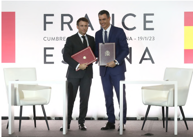
El Presidente de Francia, Emmanuel Macron (i) y el Presidente del Gobierno, Pedro Sánchez (d), posan tras la firma de un Tratado de Amistad entre sus respectivos países, durante la XXVII Cumbre Hispano-Francesa, 19.01.2023.

Acuerdo relativo a la imputación recíproca de existencias mínimas de seguridad de crudo, de productos intermedios del petróleo y productos petrolíferos