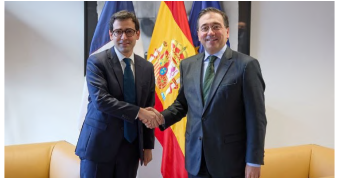
El Ministro de Asuntos Exteriores José Manuel Albares junto a su homólogo francés, Stéphane Séjourné.- Bruselas, 23.01.2024.