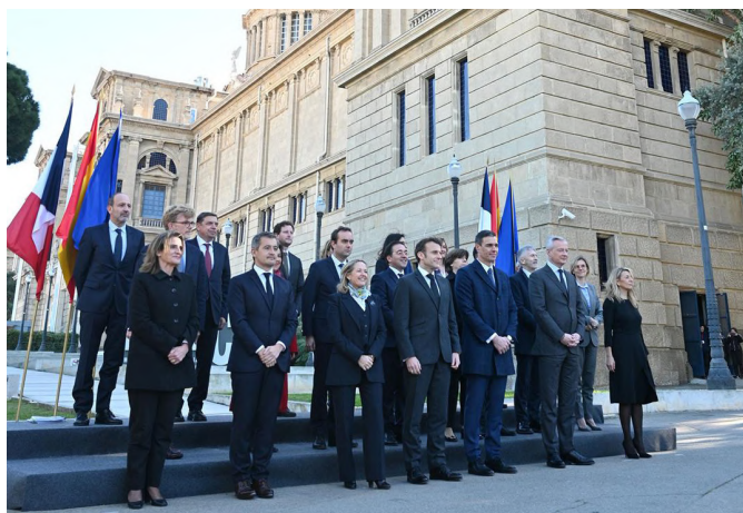
Foto de familia de Pedro Sánchez y Emmanuel Macron junto a las delegaciones española y francesa –Barcelona Museo Nacional de Arte de Cataluña (MNAC) 19.01.2023.

fluencia en los asuntos gubernamentales, especialmente aquellos vinculados con Defensa y Política Exterior. El Presidente es quien nombra al Primer Ministro. Este nombramiento no está sujeto a un proceso parlamentario de investidura, pero la Asamblea Nacional puede tramitar y aprobar una moción de censura por mayoría absoluta, que conlleva la dimisión del Primer Ministro y de todo el Gobierno. Ha sido común en algunos periodos recientes la llamada “cohabitación” en la que el Presidente y el Parlamento tienen partidos y agendas opuestas.