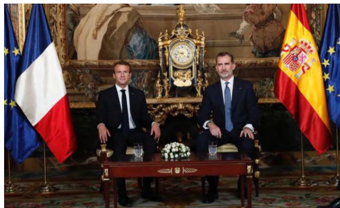
SM el Rey Felipe VI junto al Presidente de la República francesa, Emmanuel Macron. Palacio Real de Madrid, 26.07.2018.

23-24/01/2025: Viaje a París del Ministro de Asuntos Exteriores, Unión Europea y Cooperación, D. José Manuel Albares, para reunirse con su homólogo Jean-Noël Barrot.