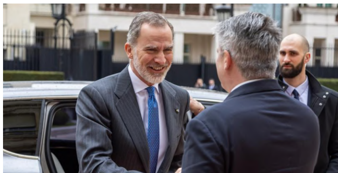
SM Felipe VI saluda al Secretario General de la OCDE, Mathias Cormann.- París 10.03.2023.