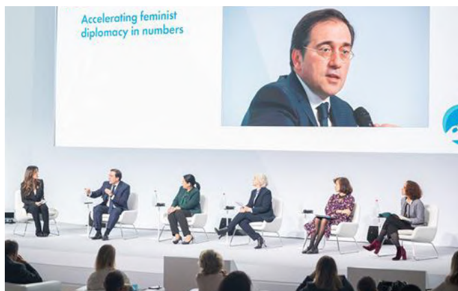
El Ministro de Asuntos Exteriores Unión Europea y Cooperación José Manuel Albares, en el Foro de la Paz de París. París, 11.11.2022.