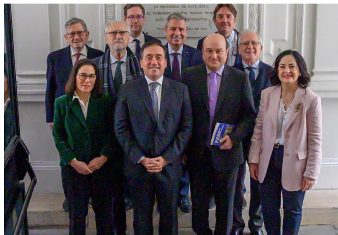
El Ministro de Asuntos Exteriores, Unión Europea y Cooperación José Manuel Albares, en el acto conmemorativo del 75º aniversario de la creación del Consejo Federal Español del Movimiento Europeo.-París, 09.02.2024.

Web: www.spain.info/fr/exterieur/office-tourisme-espagne-paris-france