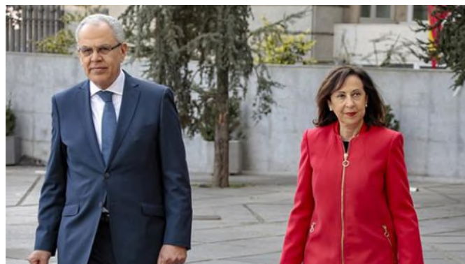
La ministra de Defensa, Margarita Robles, mantuvo un encuentro con el ministro delegado ante el jefe de Gobierno del Reino de Marruecos, encargado de la Defensa Nacional, Abdellatif Loudiy.- Madrid, 4 de marzo de 2019.