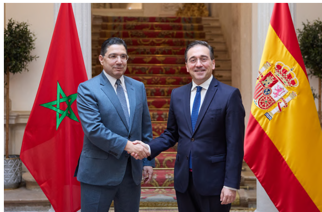
El ministro de Asuntos Exteriores español, José Manuel Albares, junto a su homólogo el ministro de Exteriores marroquí, Nasser Bourita. Madrid, 17.04.2025.