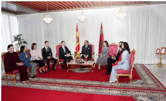
Miembros de la familia real marroquí con los Reyes de España en su visita de Estado a Marruecos.- Febrero 2019.