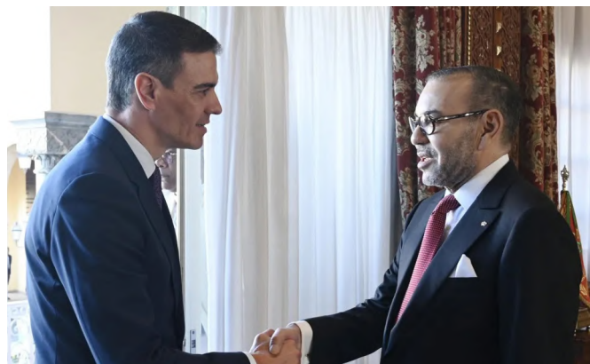
El presidente del Gobierno español, Pedro Sánchez, junto al rey Mohamed VI.-Rabat 21/02/2024.

BANCO SABADELL. Sucursal en Casablanca. BANCO SANTANDER. Participación 5% en Attijariwafabank, el principal banco del país. CAIXABANK. Sucursales en Casablanca, Tánger y Agadir.