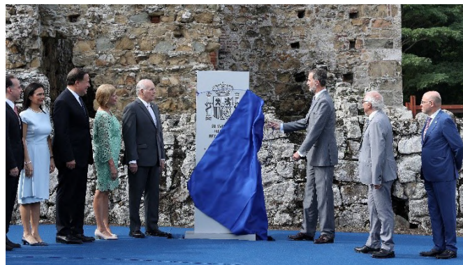
S.M. el Rey revela placa conmemorativa de su visita a Panamá Viejo en el acto conmemorativo del V Centenario de la fundación de Panamá. 30.06.2019".

Por otro lado, la cooperación cultural se encauza a través del Centro Cultural “Casa del Soldado”, ubicado en un edificio histórico del Casco Viejo de la capital, cedido por Panamá a la AECID en 2009 e inaugurado en 2013. Por Real Decreto 343/2023, de 9 de mayo, dicho centro ha quedado integrado plenamente en la red de centros culturales de AECID, a través de la Embajada de España.