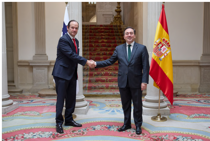
El ministro de Asuntos Exteriores español, José Manuel Albares, junto a su homólogo el ministro de Exteriores panameño, Javier Martínez Acha. Madrid, 15.07.2024.

El presidente Mulino viajó en junio de 2025 a España para participar en la Cumbre sobre Financiación del Desarrollo en Sevilla; en los márgenes, se reunió con SM el Rey y con el presidente del Gobierno.