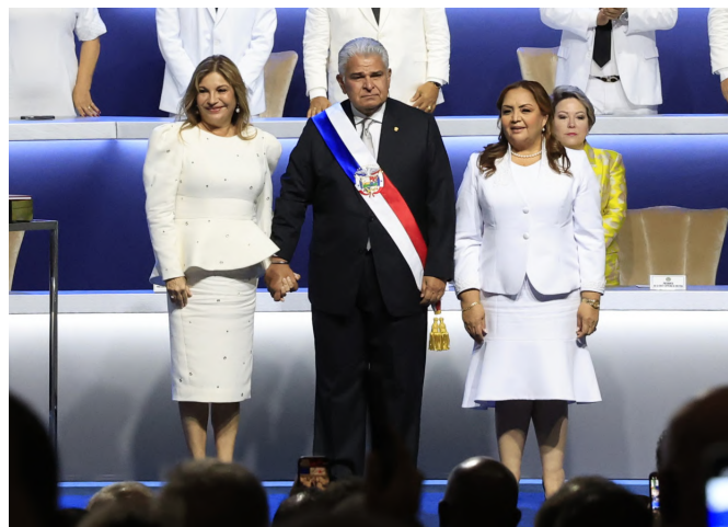
El Presidente de la República de Panamá, José Raúl Mulino Quintero, tras imponerle la Banda Presidencial, Centro de Convenciones Atlapa. Ciudad de Panamá. República de Panamá, 01.07.2024.