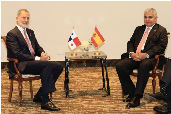
Su Majestad el Rey junto al Presidente electo de la República de Panamá, José Raúl Mulino Quintero, durante el encuentro, Hotel Sheraton Grand Panamá. Ciudad de Panamá. República de Panamá, 01.07.2024.

La privilegiada posición geoestratégica ha facilitado una tradición del país como centro/hub internacional de bienes, servicios, personas y capitales y, por ende, de comercio, banca y logística determinando una estructura económica peculiar en Panamá, que cuenta así con potentes motores de creci-