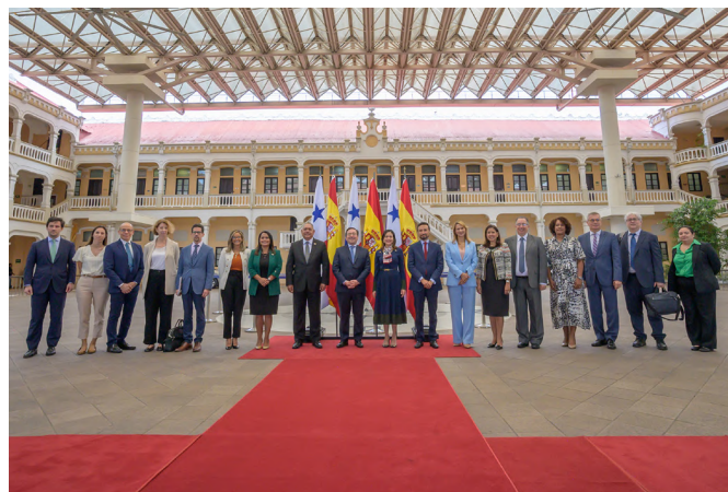
Visita del ministro de Asuntos Exteriores, Unión Europea y Cooperación, José Manuel Albares Bueno.-Panamá 6/marz0/2024.