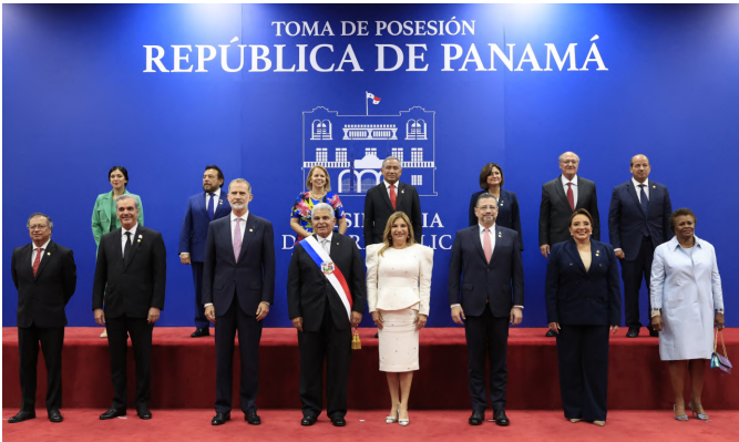
Fotografía de grupo de Su Majestad el Rey con el Presidente de Panamá y los jefes de Estado y de Gobierno asistentes a la Toma de Posesión, Centro de Convenciones Atlapa. Ciudad de Panamá. República de Panamá, 01.07.2024.

La Constitución política de la República de Panamá, promulgada en 1972 y enmendada en 1983, establece como forma de Estado la República Presidencialista con un sistema democrático de gobierno basado en tres órganos separados: Legislativo, Ejecutivo y Judicial.