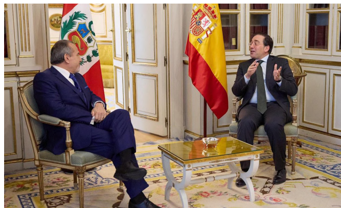
El canciller de Perú, Elmer Schialer, realizó una visita oficial a España, invitado por el ministro de Asuntos Exteriores, Unión Europea y Cooperación, José Manuel Albares, 25.11.2024.

SS.MM. los Reyes realizaron un viaje de Estado en noviembre de 2018. Con ocasión de esta visita, los ministros de Asuntos Exteriores de ambos países suscribieron los siguientes acuerdos: Memorando de entendimiento en el campo de la cooperación en armamento y material de defensa; Acuerdo Interinstitucional entre Radio Televisión Española y el Instituto Nacional de Radio y Televisión del Perú (IRTP); Memorando de entendimiento en materia antártica; y la Declaración conjunta en torno a la conmemoración del bicentenario de la independencia del Perú.