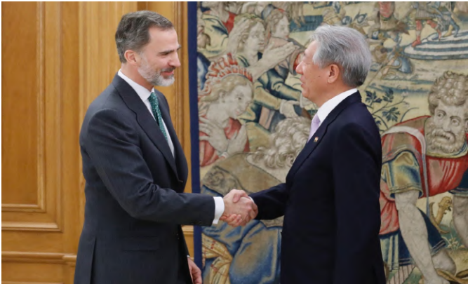
Su Majestad el Rey recibe el saludo del viceprimer ministro de Singapur y ministro coordinador para la Seguridad Nacional, Teo Chee Hean.-Palacio de La Zarzuela. Madrid, 12.03.2018.

El stock y los flujos de inversiones directas, cartera e inmuebles son muy relevantes en ambos sentidos destacando la posición inversora en torno a 4.000 millones de euros de Singapur en España, según el registro español de inversiones.